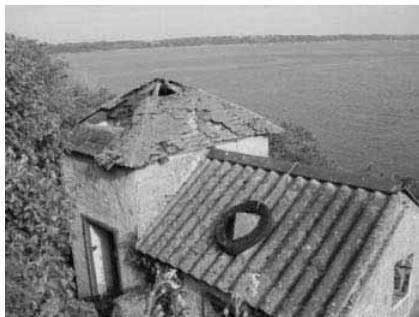
La soue à cochon avant rénovation