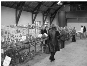
Vente de sets et marché au Forum

Les arts, la culture et la gastronomie n'étaient pas en reste puisque plusieurs expositions ventes étaient proposées : compositions