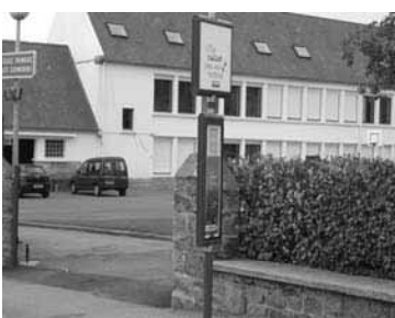
Le parking relais, situé rue de Kerrot dans la cour de l'école.

Pour 2007 : Améliorer l'information et le stationnement, prévoir une surveillance accrue dans ces rues.