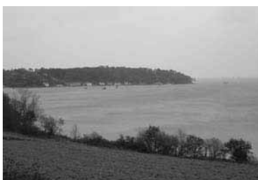
Le sentier côtier de Ty Nod-Roch Glaz sera ouvert courant décembre.