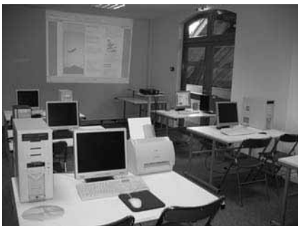
La salle Beg Lemm située dans l'espace André Jacq accueille le Club Informatique

1998: Création du Club Informatique Carantécois. Près de 500 personnes l'ont fréquenté à ce jour.