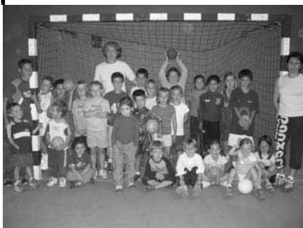
Joueurs en herbe ...