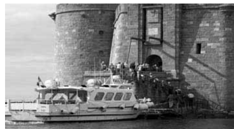
92 personnes ont participé à la sortie au château du Taureau