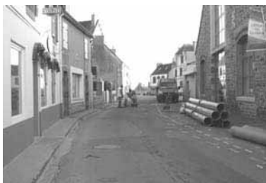
Début du chantier rue Pasteur