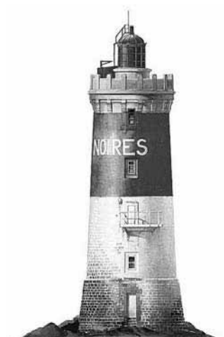
Aquarelle de Jean-Benoît Héron

La Galerie Carantec - 22 rue Pasteur 02 98 67 93 40