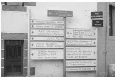
Réflexions pour régler et harmoniser la signalétique commerciale.