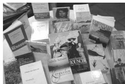
Des nouveautés sont acquises tous les mois pour satisfaire les nombreux lecteurs

Si vous trouvez que le père Noël ne vous a pas déposé assez de livres dans vos souliers, vous pouvez toujours venir à la bibliothèque. Ce sont aujourd'hui près de 10 000 ouvrages qui vous attendent et 800 nouveaux livres ou magazines ont été ajoutés au fonds déjà existant depuis le début de l'année. Récemment 150 nouveautés ont été acquises pour étoffer l'ensemble des livres de