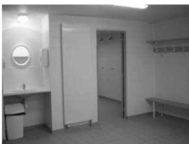
Les vestiaires du stade Jean Madec