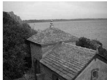
La soue à cochon après rénovation

Concernant les conditions d'occupation, les grandes orientations fixées à l'origine du projet par le groupe de pilotage se confirmeraient :