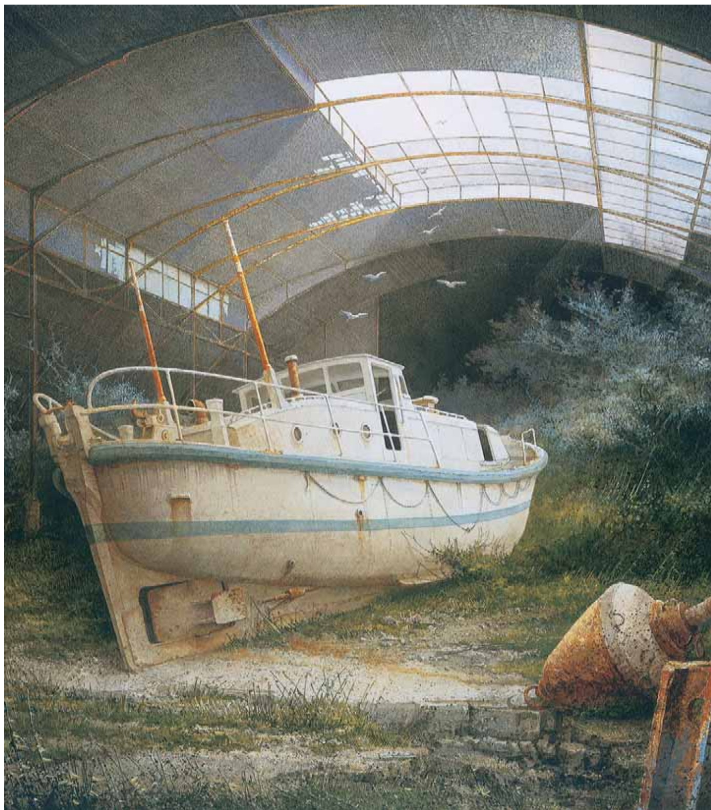
Jean-Marie POUMEYROL - Le bateau de sauvetage