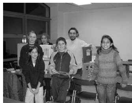
Le groupe des adolescents et leur professeur

Les cours de flûte traversière, de flûte à bec et d'éveil musical, n'ont