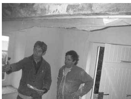
Une équipe de l'AFPA sur le chantier

25 000 € de fournitures ont permis à l'AFPA de Morlaix (Association de Formation professionnelle Adulte) de rendre à la maison du gardien de phare tout son charme. Une solution reste à trouver pour résoudre le problème des quantités d'eau de pluie récupérées, qui peuvent vite se révéler insuffisantes. Différentes options sont à l'étude.