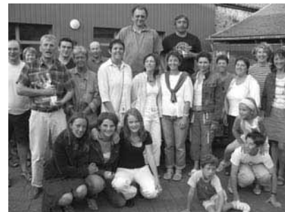
L'équipe de bénévoles de la J.S.C. et de l'entente Carantec-Taulé.

Contacts : 02.98.63.25.56 ou 02.98.67.02.77