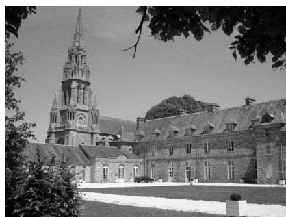
Le château de Quintin

Comme chaque année, l'association a repris ses activités à l'automne avec une fort sympathique visite à Quintin « petite cité de caractère », une des « Villes de Toiles » des Côtes d'Armor : Visite du Château et de ses collections diverses, déjeuner dans une ancienne écurie du château et promenade guidée de la ville ont ponctué cette sortie du 27 septembre dernier.