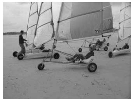
Initiation au char à voile à Santec pour les trois classes de 6 ème

Dès la 2 ème semaine de septembre, les trois classes de 6 ème ont passé trois jours à Santec pour un séjour d'intégration, qui leur a permis de faire connaissance.