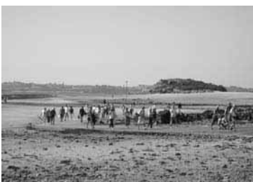
Place aux piétons ...

Point faible : Certaines navettes circulent à vide ou avec peu de visiteurs. Dans la mesure où un bus toutes les 10 mn est annoncé, il est difficile d'ajuster les passages aux besoins du moment.