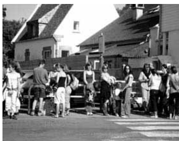
Attente du bus au Port pour rejoindre le parking relais.

Pour 2007 : Étudier les conditions pour laisser certains bus aller jusqu'à l'île. Des raisons de sécurité empêchent le retour de tous les promeneurs en bus dans la dernière demi-heure.