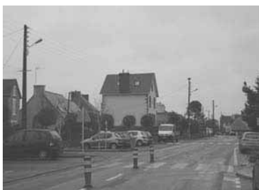
Rue des 3 Frères Tanguy : prochaine tranche des effacements de réseaux