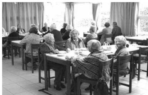
D'une capacité d'accueil de 43 studios, la résidence de Kerlizou peut accueillir des personnes seules ou des couples et apporter une réponse de proximité aux habitants de la commune et de ses environs.

En journée : une aide-soignante et deux à trois agents de service veillent au confort physique et moral des résidents. Ils assurent le service des repas de midi et du soir, ainsi que l'entretien des appartements. Des animations sont régulièrement proposées avec pour but le maintien des capacités intellectuelles et physiques des résidents. La nuit, une garde de nuit est présente, répondant aux appels. Les repas sont préparés sur place et pris en commun. Les résidents prennent leurs petits déjeuners dans leurs appartements. Le restaurant est ouvert aux familles et amis des résidents ainsi qu'aux personnes âgées de la commune. Entrer en établissement relève d'un choix, décision souvent difficile à prendre. Le personnel