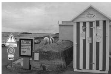
Le Point d'accueil au Port

Pour 2007 : Durée de l'opération à adapter ?