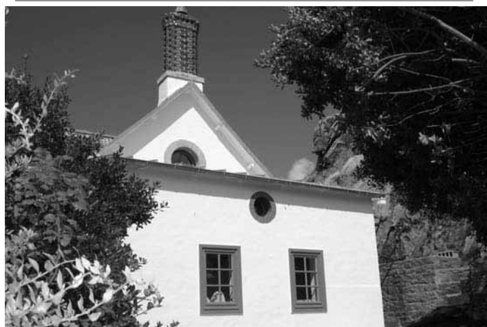
La qualité des travaux de remise en état réalisés par l'AFPA mérite d'être soulignée.

Pas de réservation possible avant mai 2007