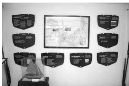
Le réseau Sibiril : plaques des bateaux qui ont fui en Angleterre

et Plages de Carantec " : Dessins et peintures de Pierre Cavellat ( 1901-1995). L'exposition d'été a été consacrée à la construction navale à Carantec, une tradition forte qui remonte à plusieurs générations ... Plans, photos, tableaux, maquettes ont fait vivre ou revivre les chantiers aussi bien ceux qui sont toujours en activité que ceux disparus au fil du temps.