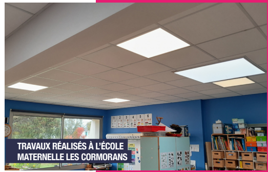
TRAVAUX RÉALISÉS À L'ÉCOLE MATERNELLE LES CORMORANS

En complément de ces efforts, la commune favorise l'essor des énergies renouvelables. À l'occasion de la rénovation de la salle du Kelenn, une centrale photovoltaïque sera ainsi installée sur 520 m 2 de toiture et deux études de faisabilité pour l'installation de ces panneaux sur le bâtiment de la mairie et de l'école primaire des Cormorans vont être entreprises. ▲