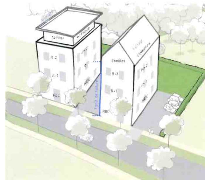
Schéma à titre illustratif

Commune de Plougasnou : RdC + 2 niveaux + combles/attique. Dans tous les cas, le point le plus haut de la construction ne pourra excéder 13 mètres.