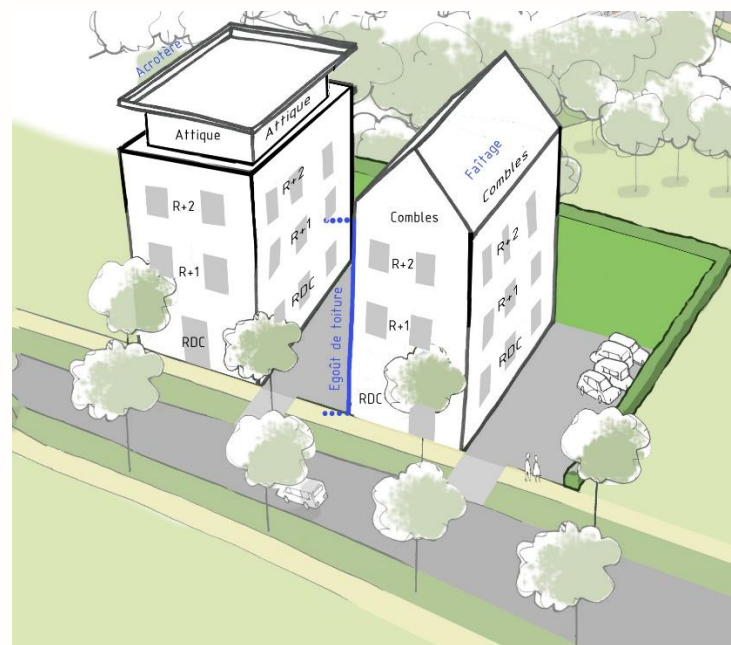
Schéma à titre illustratif

Commune de Plougasnou : RdC + 2 niveaux + combles/attique. Dans tous les cas, le point le plus haut de la construction ne pourra excéder 13 mètres.